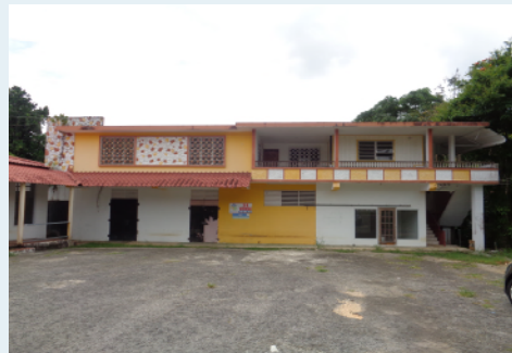
CARR 483, KM 4.1, PIEDRA GORDA CAMUY 4.86 CUERDAS $354,000.00 OMO