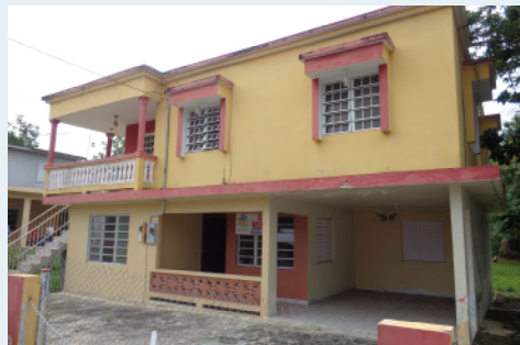
LOT #32, CALLE #1, CACAO QUEBRADILLAS 534 METROS CUADRADOS $66,000.00 OMO