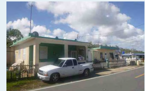
CARR# 113, KM 4.9, BARRIO COTO ISABELA 332 METROS CUADRADOS $71,000.00 OMO