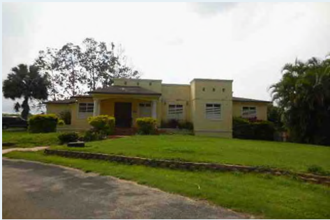
PR 113, KM 13.1 INT, CACAO QUEBRADILLAS 2,946 METROS CUADRADOS $280,000.00 OMO