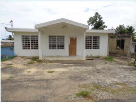
PR 478, KM 2.5, SAN ANTONIO QUEBRADILLAS 430.52 METROS CUADRADOS $74,000.00 OMO