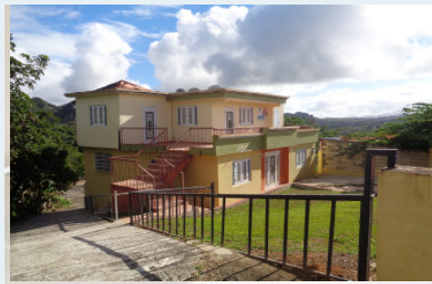
CARR # 111,R602,KM 0.4, ANGELES UTUADO 4,157 METROS CUADRADOS $141,000.00 OMO