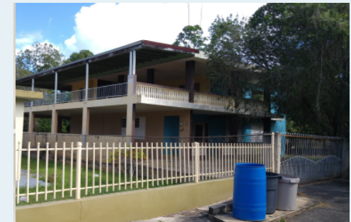
CARR 657, KM 1.3, ARENALEJOS ARECIBO 2,424.12 METROS CUADRADOS $169,000.00 OMO