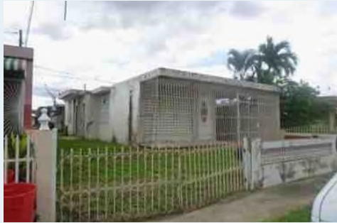
B-24,10 ST. BRISAS DE AÑASCO DEV. AÑASCO 233 METROS CUADRADOS $76,000.00 OMO