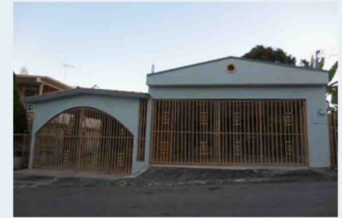
LOT. 138 #7 STREET, SANTA ROSA COMM, LAJAS 357.56 METROS CUADRADOS $76,000.00