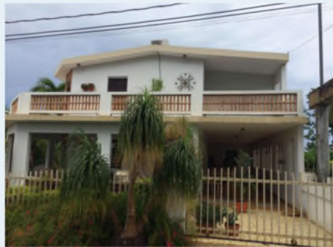
LOT #10, COM VICENTITA, COCOS QUEBRADILLAS 915 METROS CUADRADOS $255,000.00 OMO