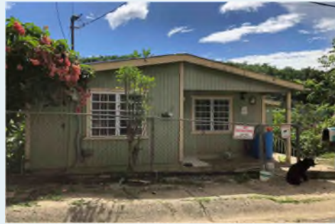
621, CARACOLES II COMMUNITY PENUELAS, 338 METROS CUADRADOS $50,000.00 OMO