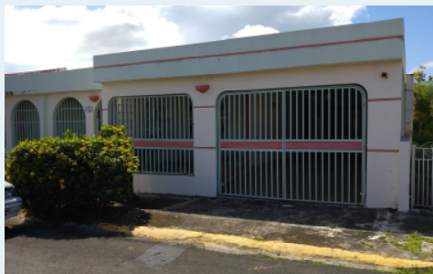
FS-12,CALLE LLORENS TORES,LEVITTOWN TOA BAJA 310.50 METROS CUADRADOS $136,000.00 OMO